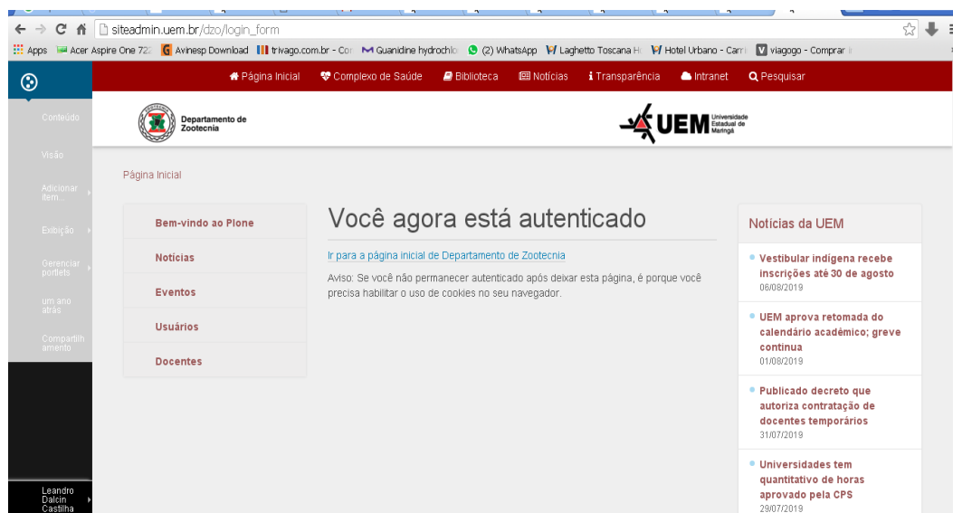
Figura 2. Home Page do DZO na nova plataforma (Plone 5).

Até o momento está sendo realizada a coleta de dados, para a atualização do site, treinamento da equipe executora, que cuidará da reestruturação e manutenção junto ao NPD. Como principal resultado parcial, já é possível verificar o layout da nova plataforma da Home Page do DZO (Figura 2), que ainda encontra-se em construção.